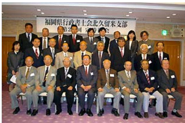
総会終了後の記念写真

日時： 平成20年4月25日(金) 午後3時～5時 場所：原鶴温泉 ホテルパーレンス小野屋