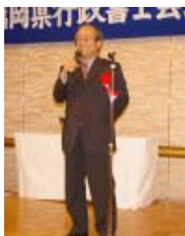
衆議院議員 古賀一成様