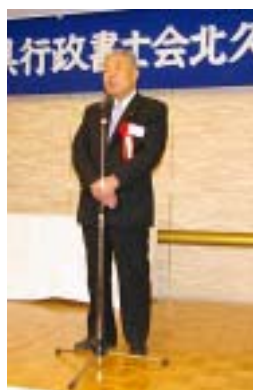
福岡県議会議員 出利葉 史郎様